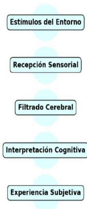
Diagrama de la percepción Como Construimos Nuestra Realidad